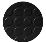
Pastilles (MC 2K1)